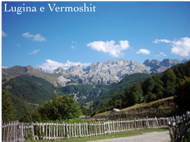
Lugina e Vermoshit