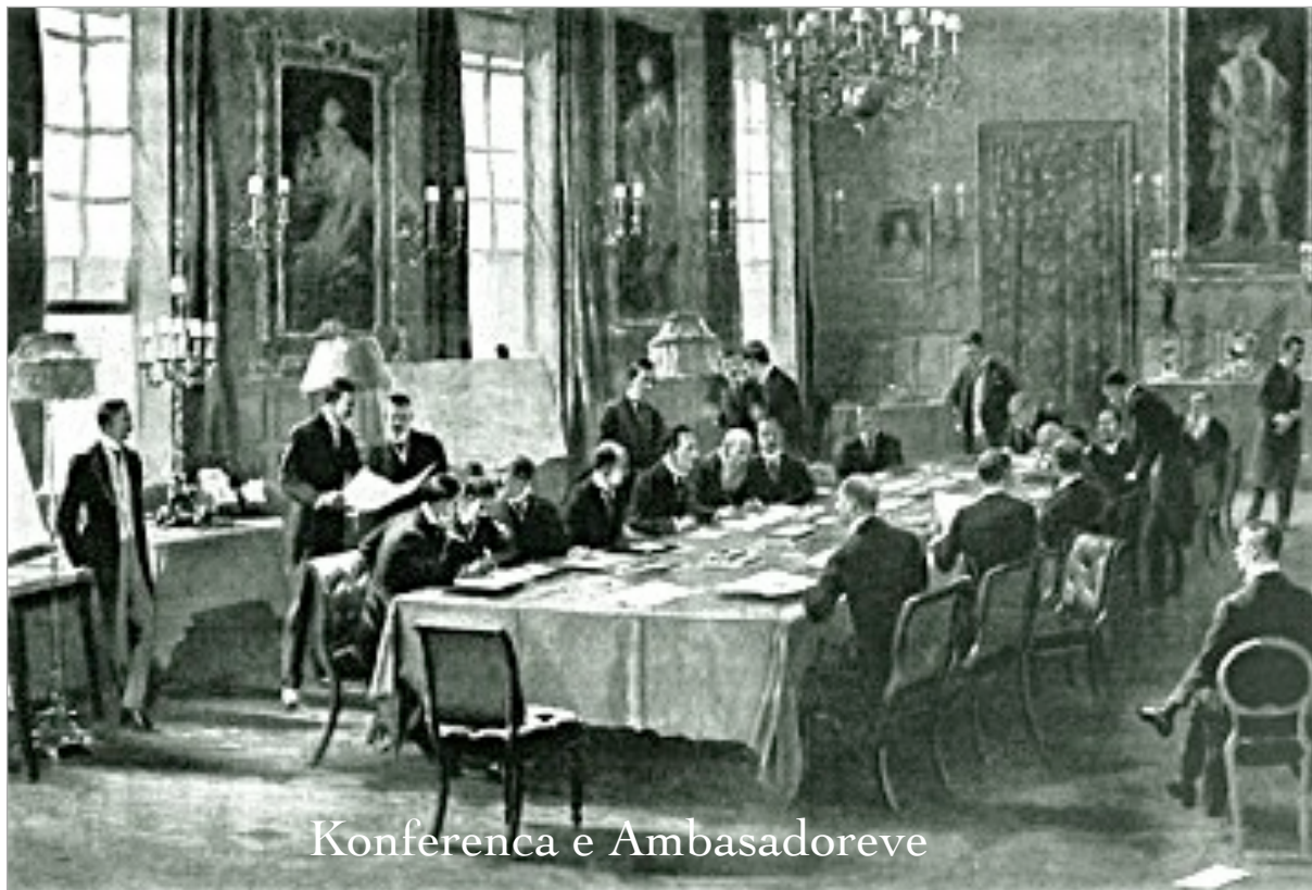
Konferenca e Ambasadoreve

Çështja se kujt i përkiste Manastiri i Shën Naumit u përfshi me kërkesën e Jugosllavisë në arenën diplomatike më 9 nëntor 1921 - pikërisht atëherë kur nga pikëpamja juridike çështja ishte mbyllur, pasi atë ditë (9 nëntor 1921), Konferenca e Ambasadorëve miratoi vendimin me