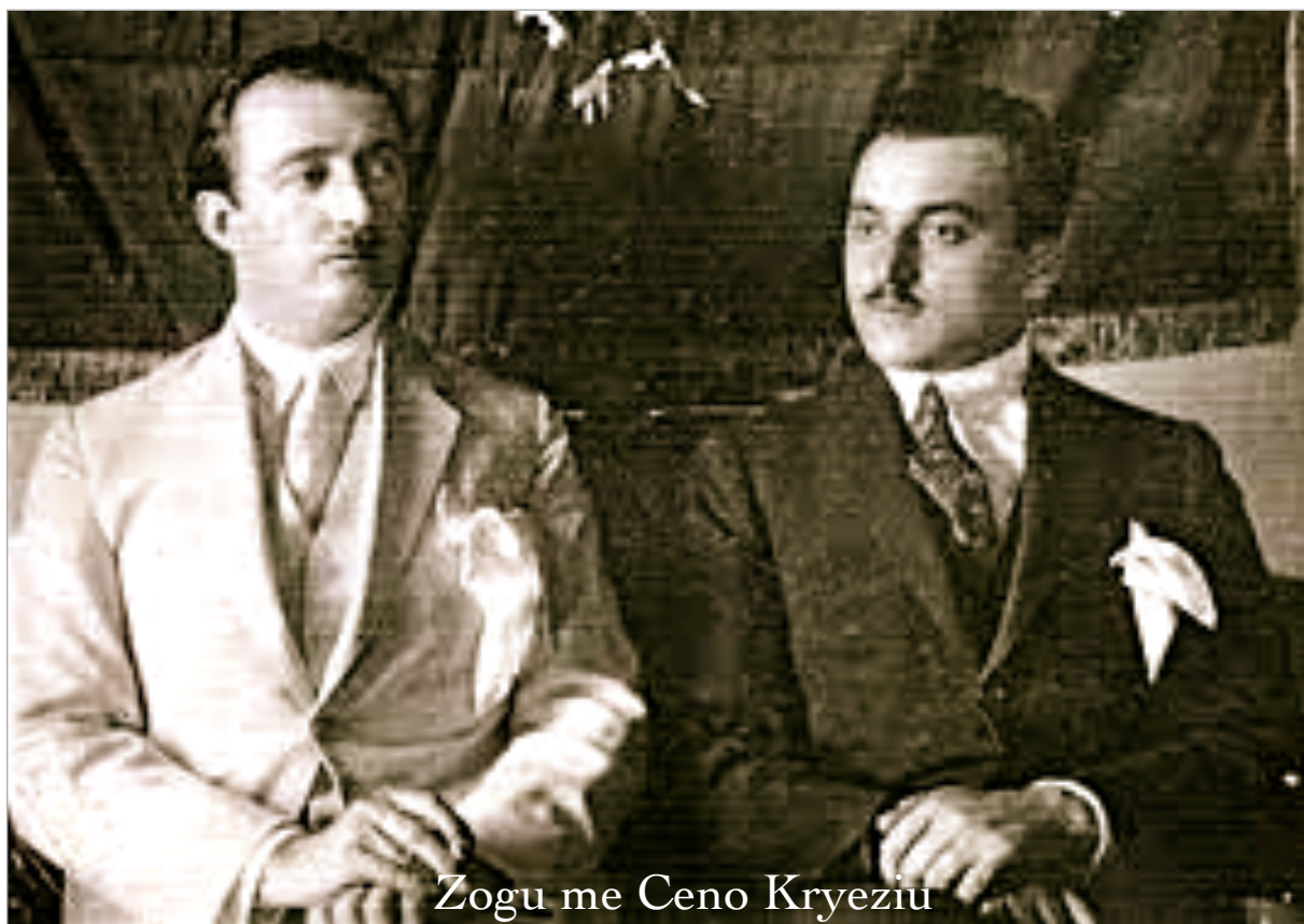
Zogu me Ceno Kryeziu

e fshehtë të 14 gushtit 1924. Për këtë qëllim, atij i duhej të siguronte një mbështetje të fuqishme në arenën ndërkombëtare. Mbështetjen e gjeti tek Italia fashiste. Derisa të realizonte marrëveshjen me Italinë fashiste, Zogut i duhej të vinte në gjumë qeverinë jugosllave. Për këtë qëllim ai emëroi në qeverinë shqiptare në krye të dikastereve më të rëndësishme, dy ministra me prirje kontradiktore - Ceno beg Kryeziu ministër i Punëve të Brendshme dhe Myfit bej Libohovën ministër i Financave dhe zv.ministër i Punëve të Jashtme.